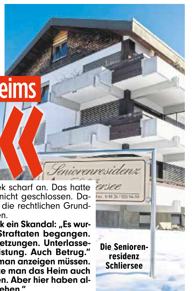
Die Seniorenresidenz Schliersee